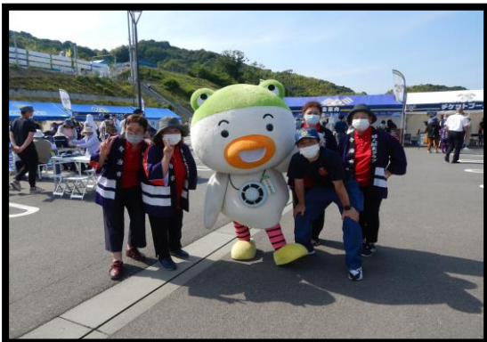
FC今治ホーム戦 広報活動